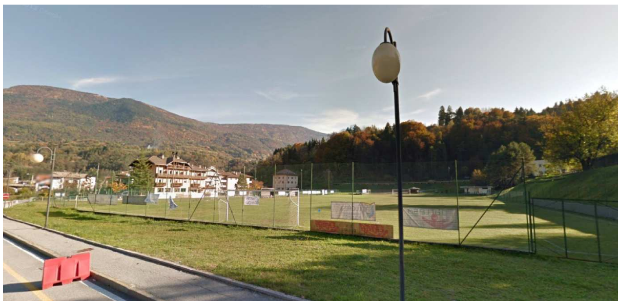
fig. 02: vista dell'area da Via Lungo Sarca

L'accesso alla nuova opera pubblica si attesterà su Via Lungo Sarca in destra orografica del Sarca. La dislocazione dell'area rispetto al paese di Ponte Arche fa sì che essa risulti, da una parte, sufficientemente decentrata da non ostacolare o appesantire la viabilità urbana del paese, e dall'altra sia capace di essere attestata a qualche centinaio di metri dall'arteria principale di scorrimento del traffico sia commerciale che turistico rappresentata dalle direttrici Trento – Madonna di Campiglio – Molveno – Riva del Garda, tutte con snodo viabilistico principale a Ponte Arche.